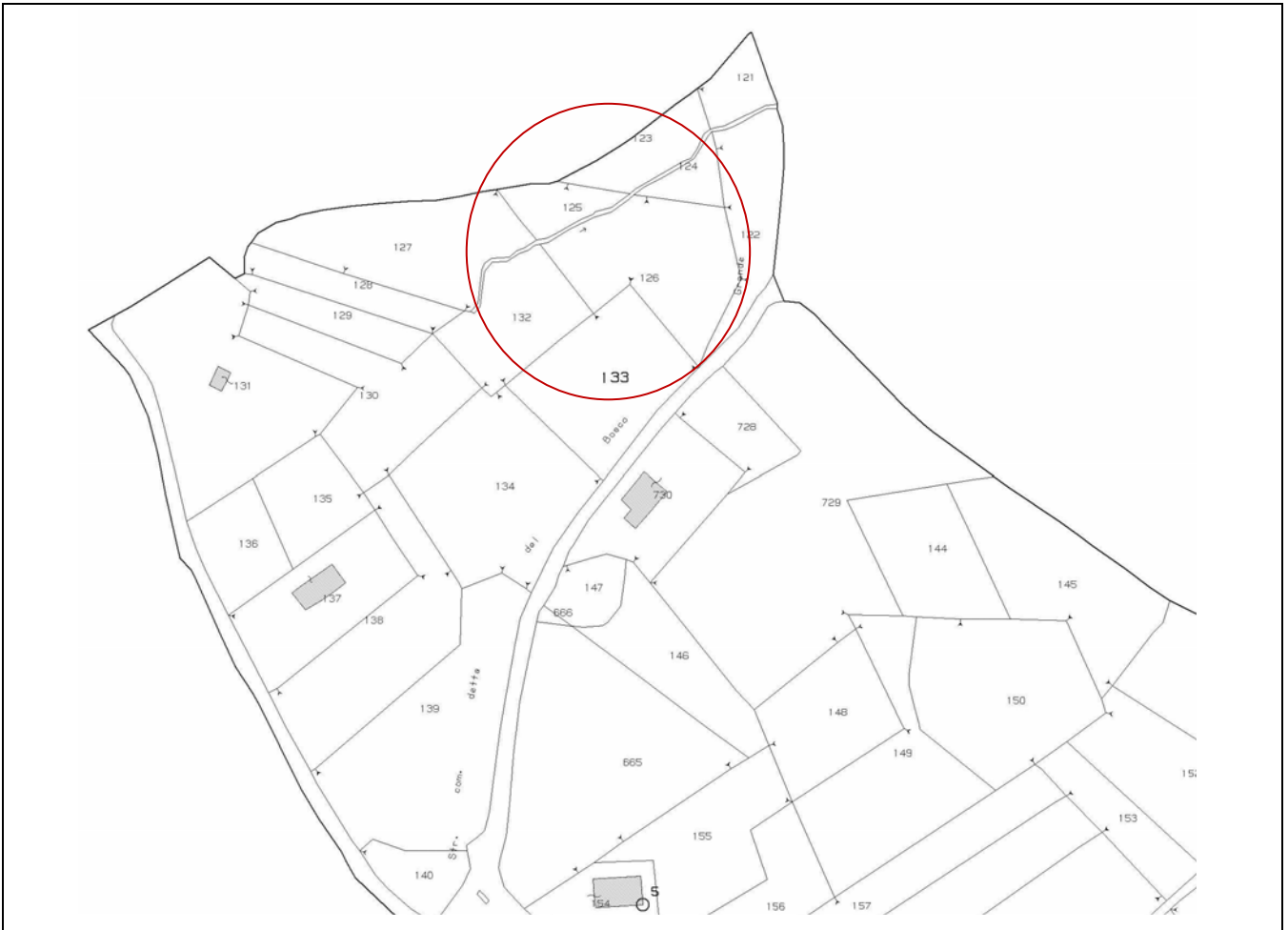
Planimetria catastale, scala 1:2.000

Si riporta l'individuazione, su base catastale, di tale ambito.